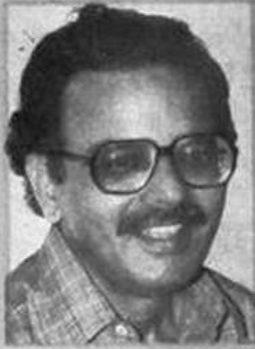
شمس الرحمن فاروقی (شخصیت اور ادبی خدمات)